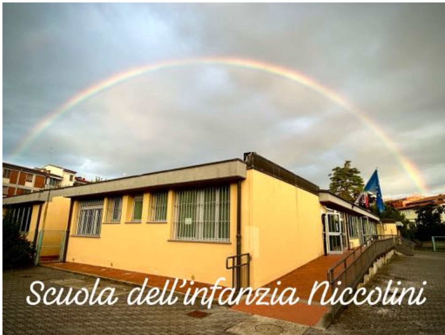
Scuola dell'infanzia Niccolini